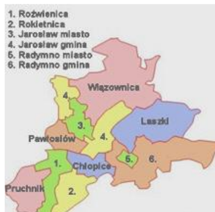
Rysunek 2. Gminy sąsiadujące

Powierzchnia miasta wynosi 34,46 km 2 , co stanowi 3,4% powierzchni powiatu i 0,2% powierzchni województwa. 72% powierzchni gminy stanowią użytki rolne. Biorąc to pod uwagę dość wysokie - na tle województwa - zaludnienie miasta, należy przyjąć, że centrum miasta jest obszarem silnie zurbanizowanym.